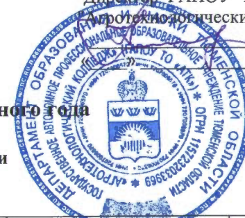
График проведения промежуточной аттестации за первый семестр 2018-2019 учебного года по программам среднего профессионального образования 35.02.06 Технология производства и переработки сельскохозяйственной продукции