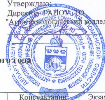
График проведения промежуточной аттестации за первый семестр 2018-2019 учебного года по программам среднего профессионального образования 35.02.08 Электрификация и автоматизация сельского хозяйства