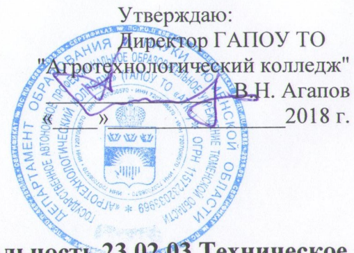
График проведения промежуточной аттестации за 1 семестр 2018-2019 учебного года специальность 23.02.03 Техническое обслуживание и ремонт автомобильного транспорта