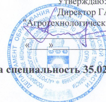
График проведения промежуточной аттестации за 1 семестр 2018-2019 учебного года специальность 35.02.07 Механизация сельского хозяйства.